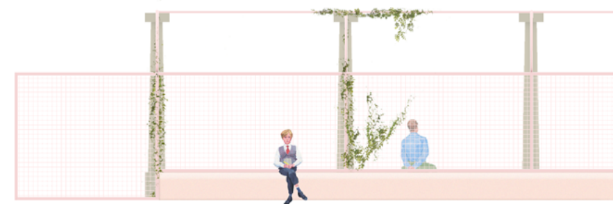
Prospetto frontale della nuova recinzione

La recinzione esistente sul lato di via San Giovanni Bosco viene riprogettata completamente per creare un nuovo limite perimetrale della Villa. Una recinzione in pannelli microforati che rimane attraversabile allo sguardo e si pone in dialogo con gli elementi architettonici fondamentali della Villa: il portico, la facciata in mattoni e il suo giardino. Questo nuovo dispositivo urbano diventa esso stesso luogo relazionale dello stare in cui poter sostare e ammirare la storia di questo luogo grazie anche al posizionamento di una lunga seduta alla base. L'antico portico viene qui reinterpretato in forma di pergolato per creare una zona d'ombra e di recupero della storia in una forma contemporanea.