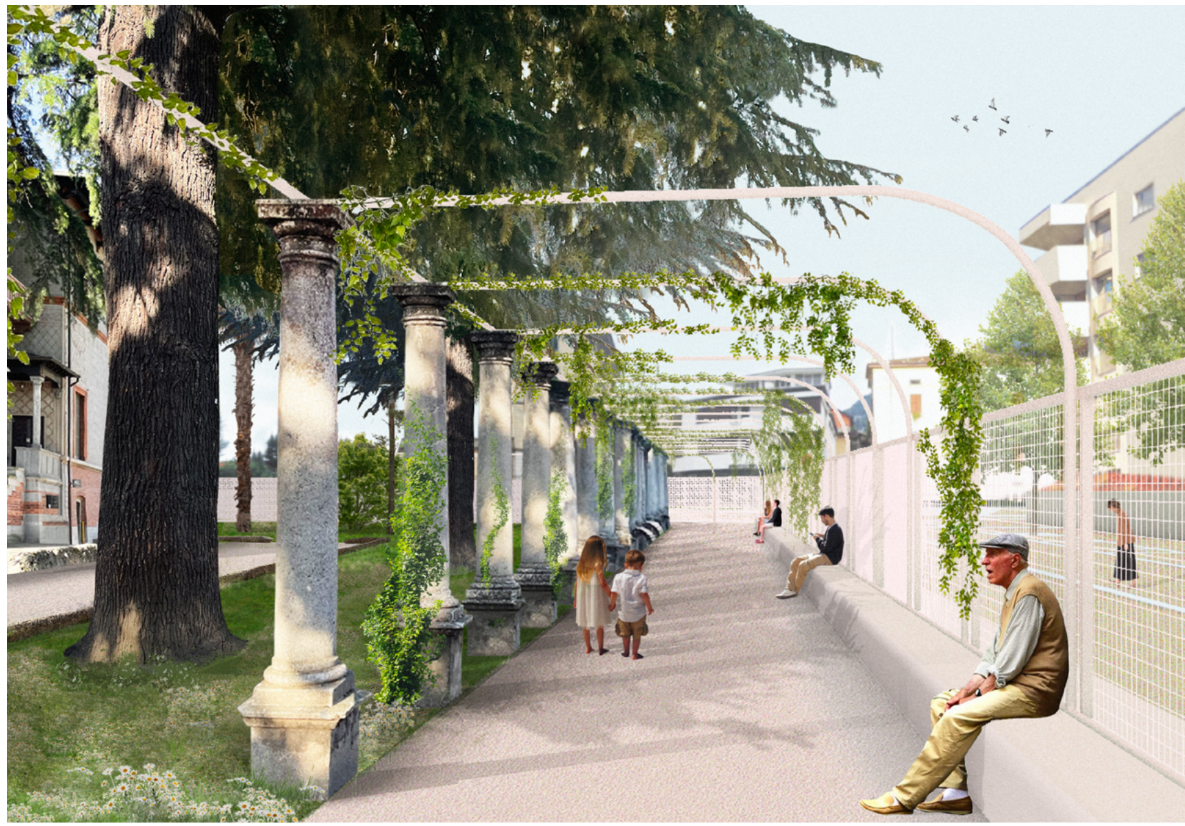
Vista all'interno del nuovo pergolato