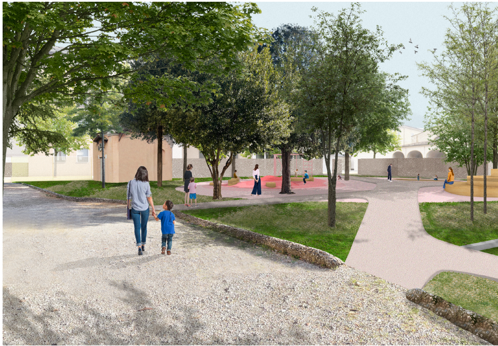
Vista dell'area gioco all'interno del giardino di Villa