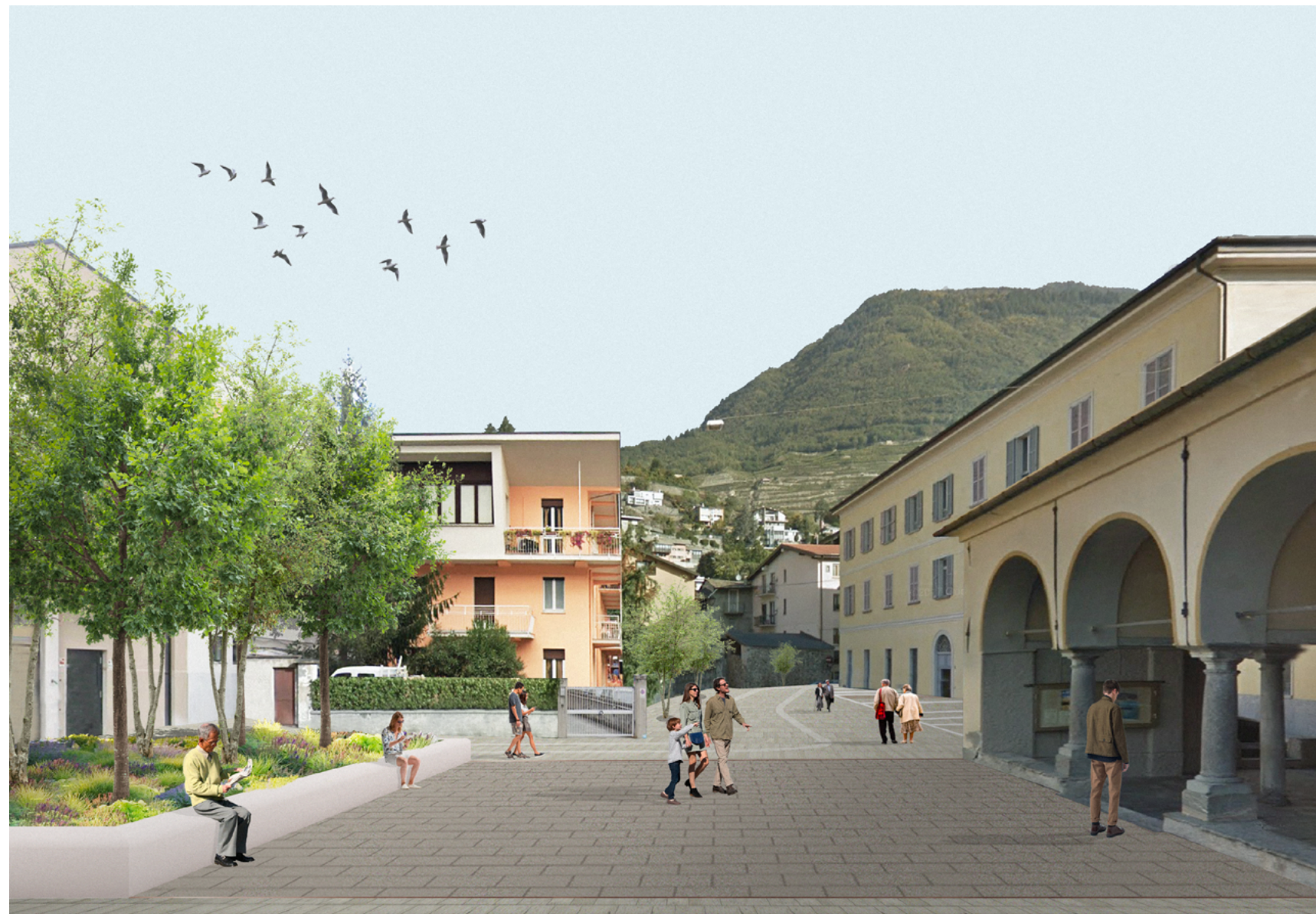
Vista della Piazza